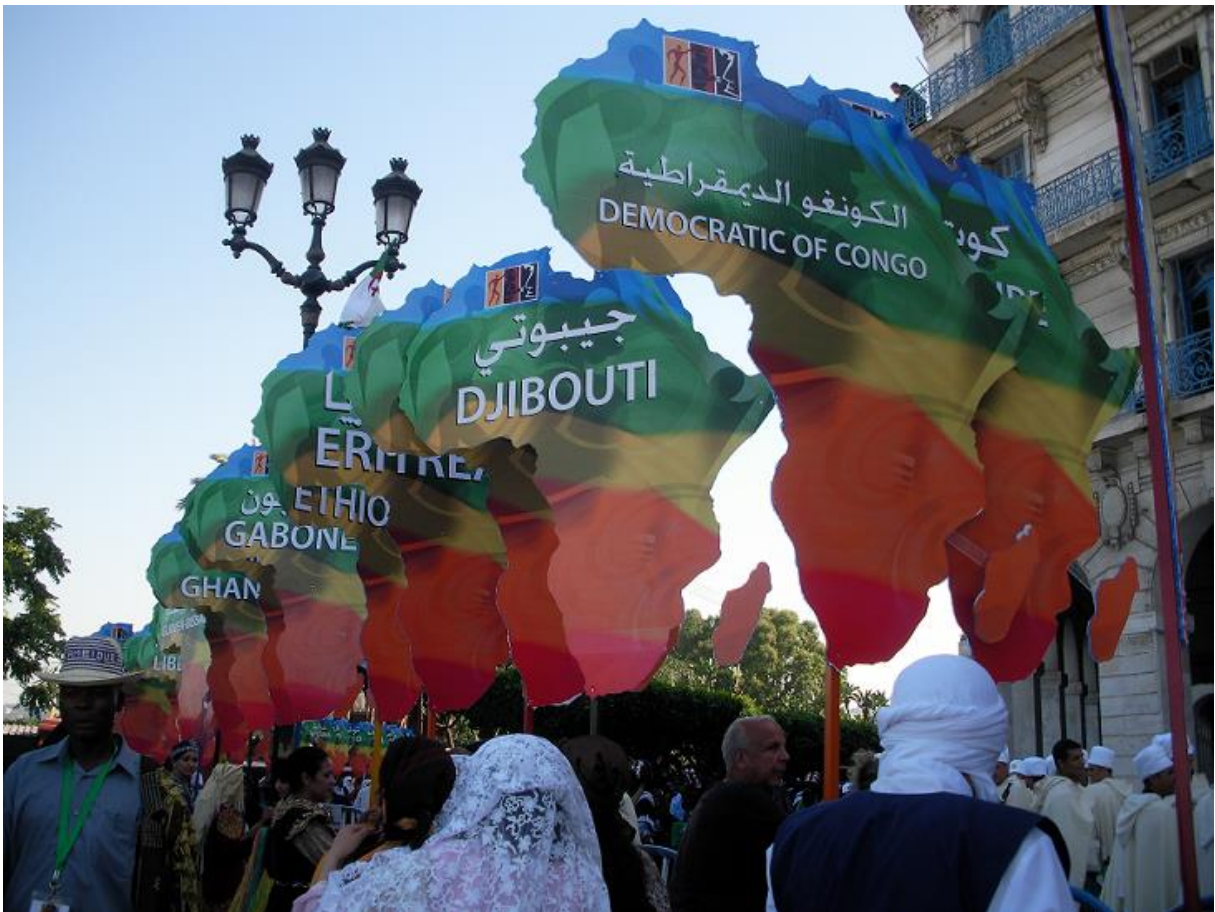
Said Chaouch : Text - EvaChaouch : Picture